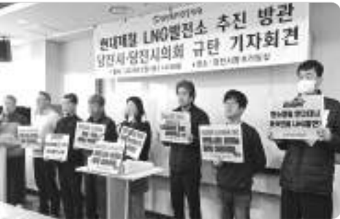
"당진시·시민사회, 현대제철 LNG발전소 추진 방관"