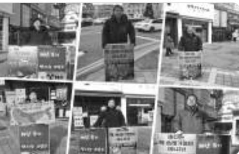
1월에도 핵오염수 해양 투기 중단 인시위 지속