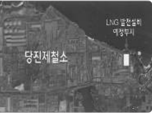
현대제철 LNG발전소 무엇이 문제?