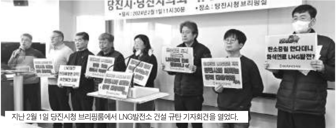
지난 2월 1일 당진시청 브리핑룸에서 LNG발전소 건설 규탄 기자회견을 열었다.

LNG발전소 건설 반대 결의안 부결에 당진환경운동연합 규탄 기자회견 개최