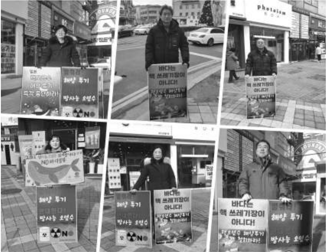
매주 후쿠시마 오염수 해양 투기 철회 1인 시위에 참가한 회원과 활동가들

당진환경운동연합이 일본 후쿠시마 핵오염수 해양투기 중단을 위한 1인 시위를 1월에도 구터미널 로터리에서 매주 지속하며 시민들에게 핵오염수 해양 투기가 끝난 문제가 아님을 환기시키고 시민들의 관심을 촉구했다.