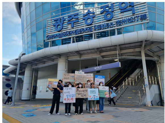
기후위기대응 명절 캠페인