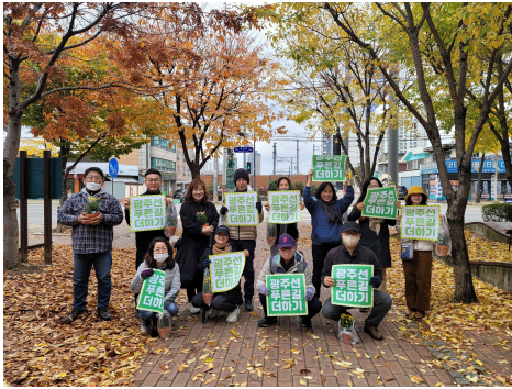
푸른길 걸어 환경연합까지