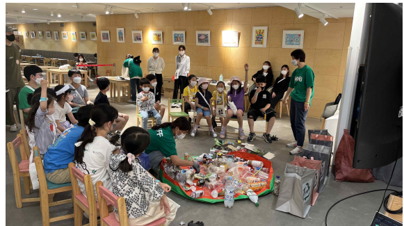
ACC 어린이문화원과 협력, 진행한 '다 함께 쓰담쓰담'(5/8)