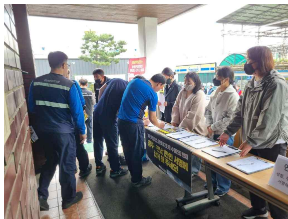
영광 한빛 1,2호기 수명연장 반대 서명운동