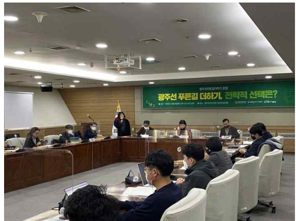
푸른길 더하기 포럼