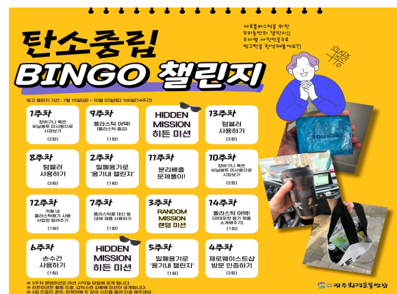
1회용품 안쓰기 100일 도전