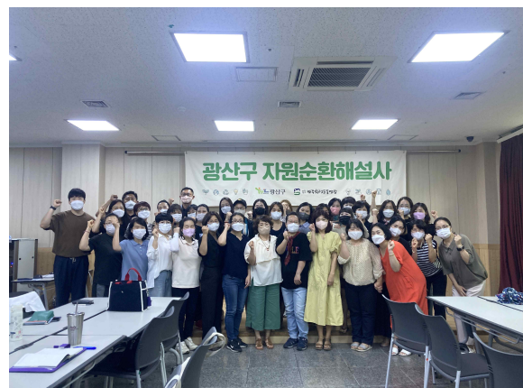
광산구 자원순환 해설사 양성교육