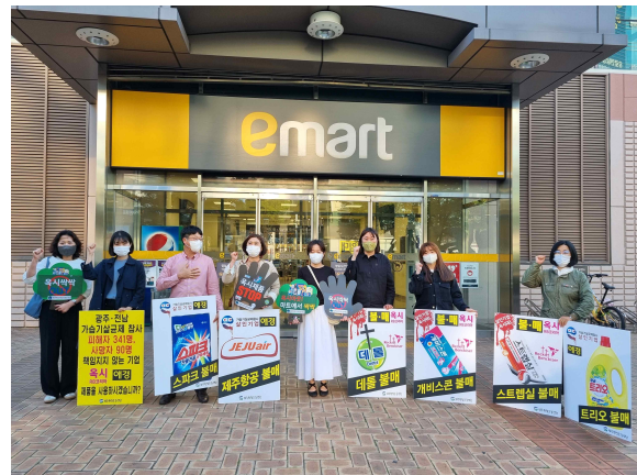
가습기살균제 살인기업 불매캠페인