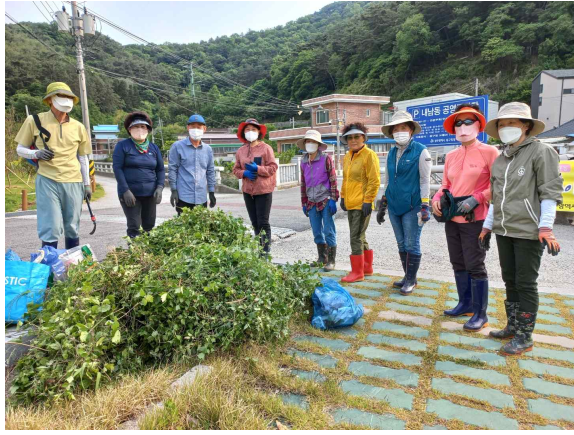
내지천 유해식물제거 및 정화활동