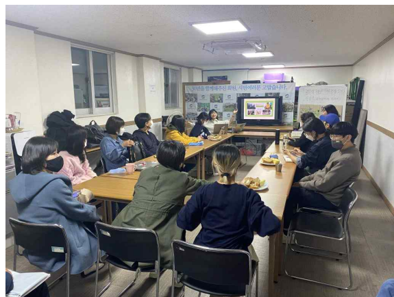
화요환경강좌_9.24기후정의행진 그 이후