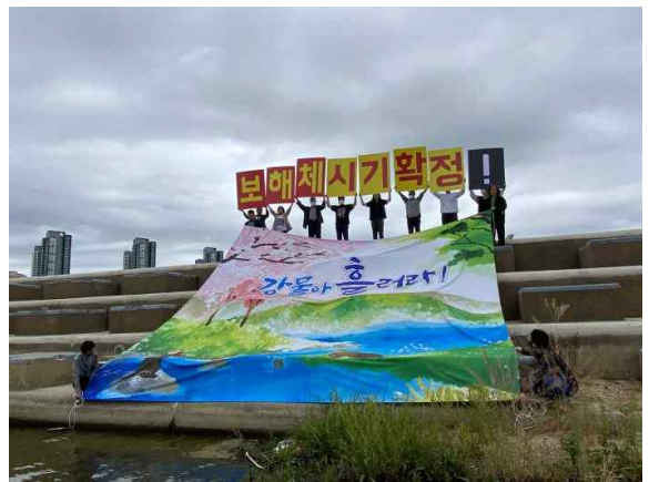
영산강·금강 보 처리방안 조속이행 촉구 퍼포먼스