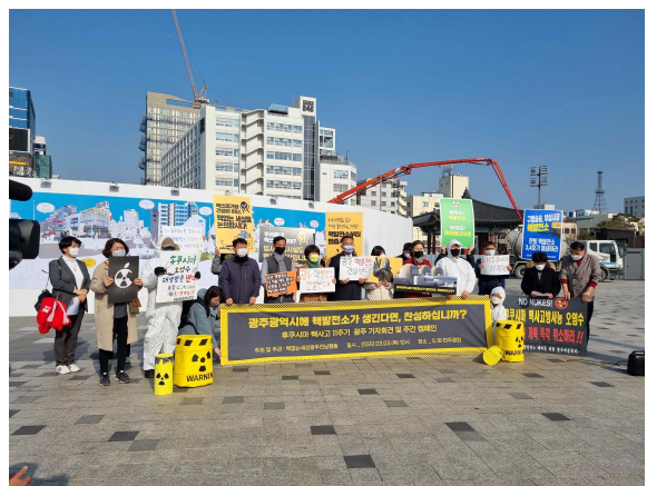
탈핵 기자회견 '광주 핵발전소 동의하십니까?'