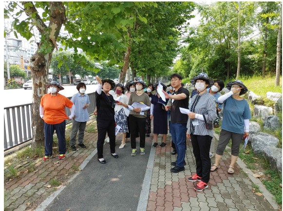
가로수 트리맵 시민모니터링