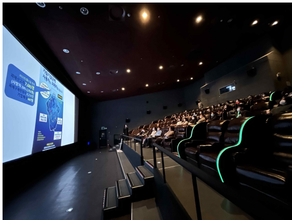
영화 공기살인 회원상영회