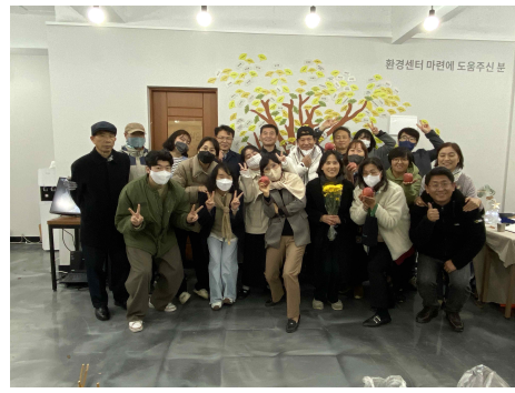
2022 후원의 날 및 집들이