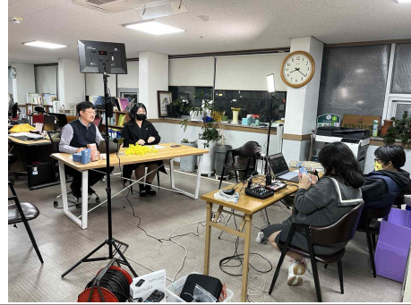
유튜브 라이브 '월간식혜' 촬영