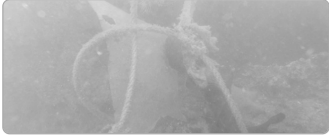
▲ 오동도 앞바다에 가라앉은 부잔교에 그물이 보입니다.