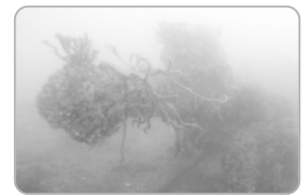
▲바다에 빠진 부잔교

여수환경운동연합은 해양환경위원회는 2014년 10월 19일경 한려해상 국립공원 오동도 수중 속을 조사하면서 부잔교 등으로 추정되는 방치폐기물이 있는 것을 확인하였습니다. 이 폐기물은 길이는 약 25미터, 넓이는 10미터, 수심 5미터 정도에 가라앉아 있는데 페타이어와 계단이 있는 것으로 봐서 부잔교의 일종으로 추정할 수 있었습니다.