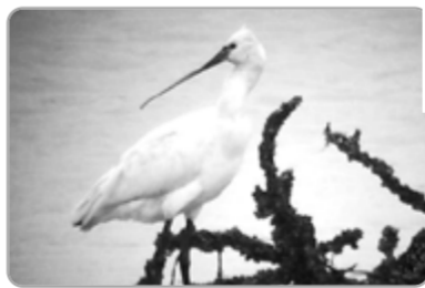
▲울촌 두봉갯벌에서 관찰된 노랑부리저어새

여수 울촌면 두봉갯벌에 천연기념물 제205호이며 환경부지정 멸종위기종2급인 노랑부리저어새가 발견돼 눈길을 끈다.